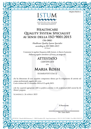
Healthcare Quality System Specialist ai sensi della ISO 9001:2015 (16 ore)