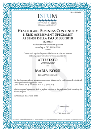
Healthcare Business Continuity e Risk Assessment Specialist ai sensi della ISO 31000:2018 (12 ore)