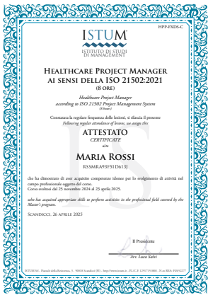
Healthcare Project Manager ai sensi della ISO 21502:2021 (8 ore)

Unitamente all'Attestato di Qualifica verranno rilasciati i seguenti attestati anch'essi in doppia lingua (italiano/inglese):