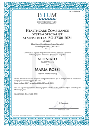
Healthcare Compliance System Specialist ai sensi della ISO 37301:2021 (8 ore)