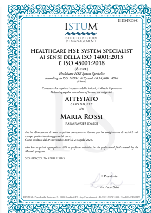
Healthcare HSE System Specialist ai sensi della ISO 14001:2015 e ISO 45001:2018 (8 ore)