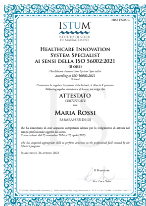
Healthcare Innovation System Specialist ai sensi della ISO 56002:2021 (8 ore)