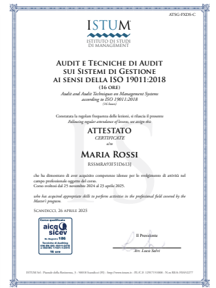
Audit e Tecniche di audit sui Sistemi di Gestione ai sensi della ISO 19011:2018 (16 ore)