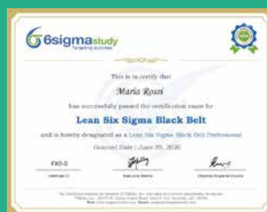
Certificazione Lean SixSigma Black Belt (LSBB)

L'esame (sostenibile per un totale di n.3 tentativi) ha la durata di 120 minuti e si compone di 90 domande a risposta multipla