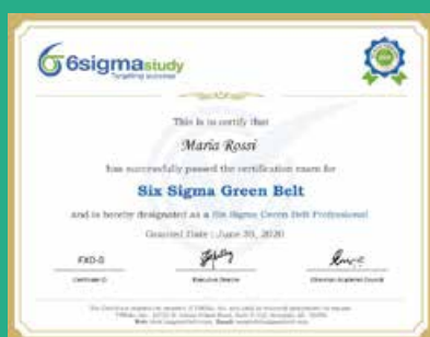
Certificazione SixSigma Green Belt (SSGB)

Tale diploma costituisce un'importante valorizzazione curriculare delle competenze e un elemento distintivo nell'ottica competitiva del mondo del lavoro.